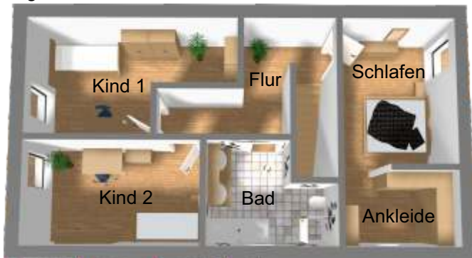
Obergeschoss unverbindliche Illustration