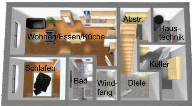
Untergeschoss unverbindliche Illustration